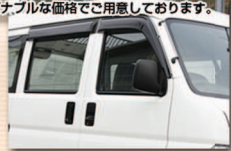
障害物保護に加入しております。